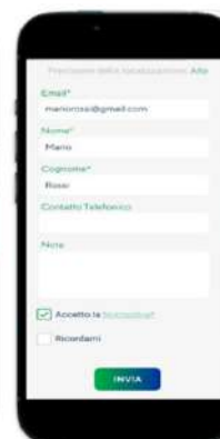
Step 4: dati segnalazione