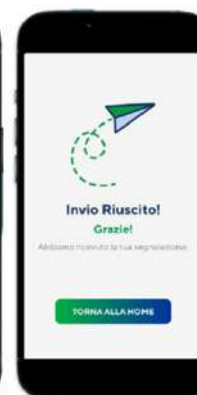
Step 5: feedback all'invio