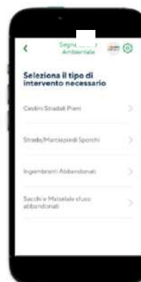
Step 2: scelta tipologia di segnalazione