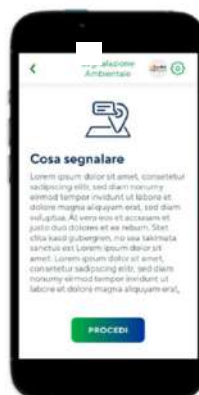
Step 1: scheda informativa generale del servizio

La segnalazione ambientale: i cittadini possono segnalare situazioni che necessitano di un intervento