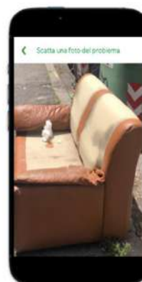
Step 3: foto della segnalazione e contestuale recupero delle coordinate geografiche